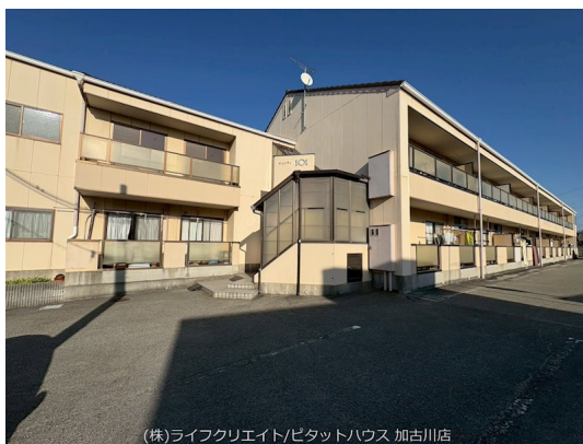
(株)ライフクリエイティブハウス 加古川店